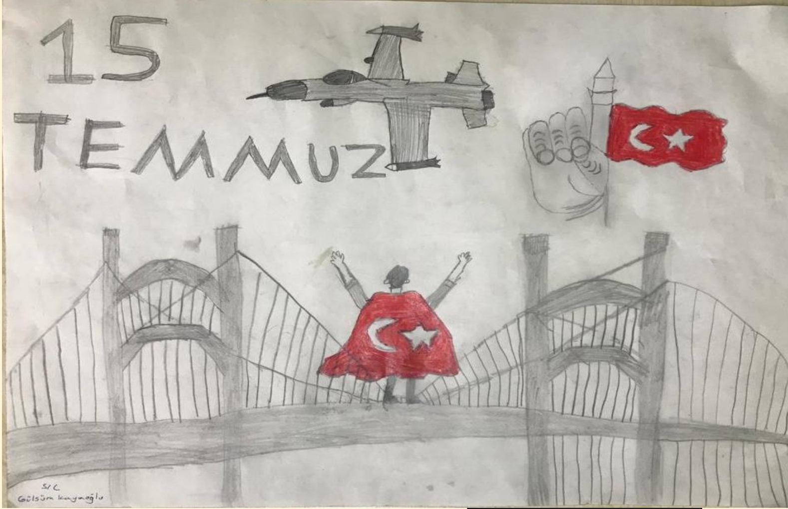
Gülsüm KAYAOĞLU 5/C

15 Temmuz 2016, Türkiye'de önemli bir olay olan darbe girişiminin yaşandığı tarihi ifade eder. Bu tarihte Türkiye, Türk Silahlı Kuvvetleri içindeki bazı askeri birimler tarafından gerçekleştirilen bir darbe girişimi ile sarsıldı. Halkın büyük bir kısmı, demokrasiye ve hükümete destek vererek meydanlarda toplandı. Bu direniş, darbe girişiminin başarısızlığa uğramasını ve hükümetin kontrolü yeniden ele geçirmesini sağladı.